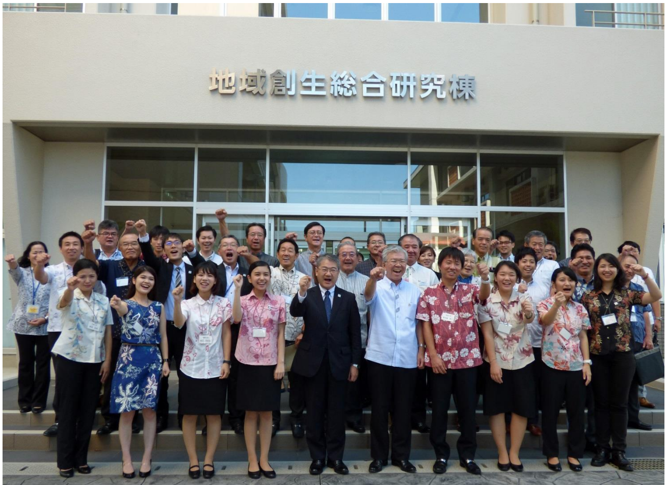
全員でトビタテ！ポーズ