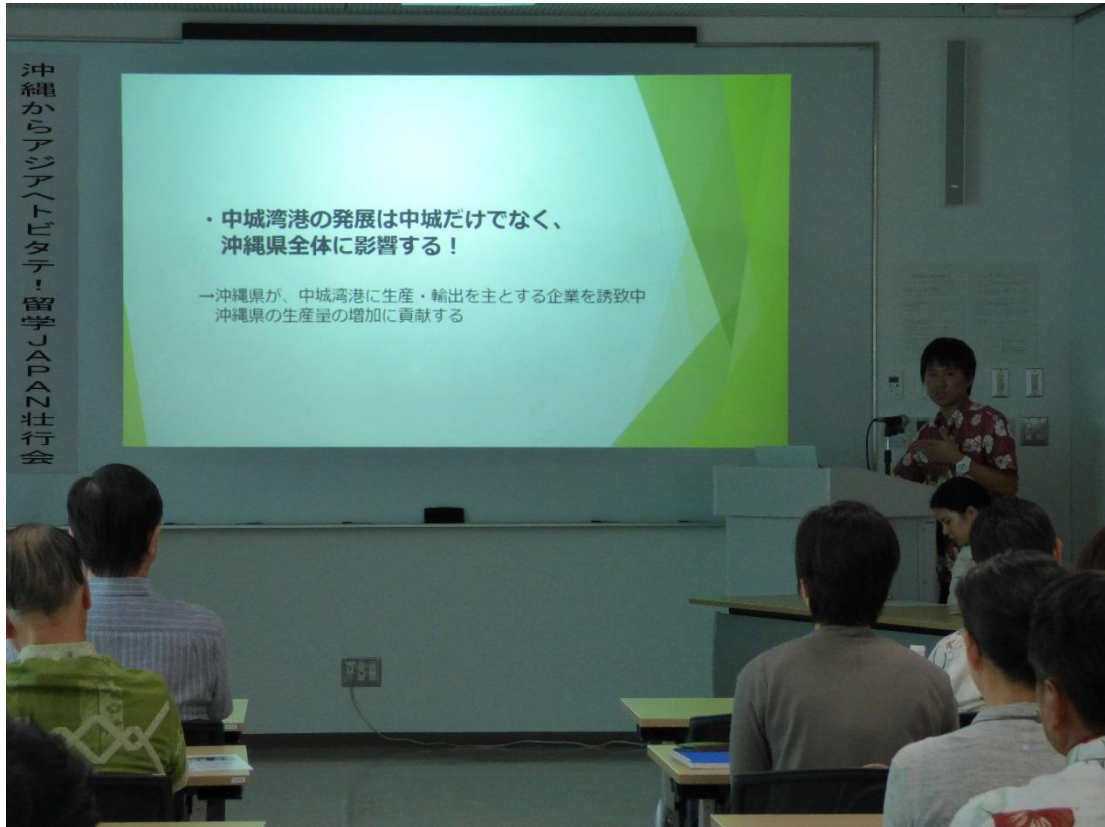
プレゼンテーションの様子